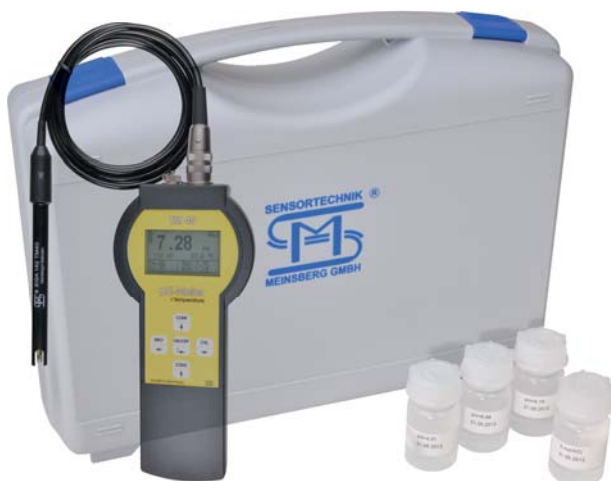
TM 40/Set mit pH-Sensor EGA 142/TM 40 TM 40/Set with pH Sensor EGA 142/TM 40