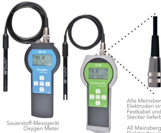
Sauerstoff-Messgerät Oxygen Meter