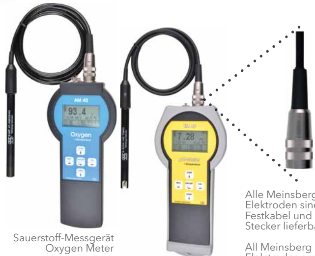
Sauerstoff-Messgerät Oxygen Meter pH-/Redox-/ISE-Messgerät mit Stoßschutz pH/Redox/ISE Meter with protective cover

Alle Meinsberger Elektroden sind mit Festkabel und BK-Stecker lieferbar.