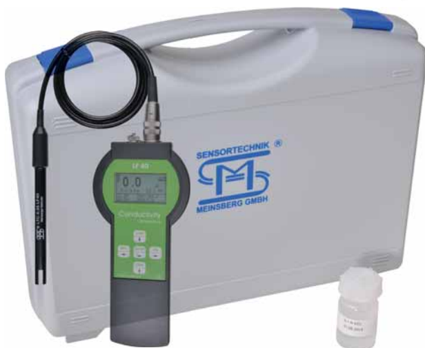
LF 40/Set mit Leitfähigkeitssensor LTC 0,35/LF 40 LF 40/Set with Conductivity Sensor LTC 0,35/LF 40