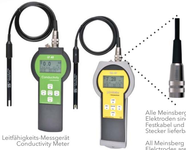
Leitfähigkeits-Messgerät Conductivity Meter pH-/Redox-/ISE-Messgerät mit Stoßschutz pH/Redox/ISE Meter with protective cover

Alle Meinsberger Elektroden sind mit Festkabel und BK-Stecker lieferbar.