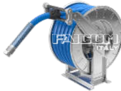
Hose reel with guide-hose arms in B position Avvolgitubo con bracci guida tubo in posizione B