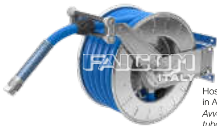
Hose reel with guide-hose arms in A position Avvolgitubo con bracci guida tubo in posizione A