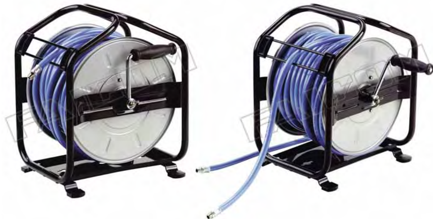
Hose reels model AM with and without hose / Avvolgitubo modello AM con e senza tubo

I modelli completi di tubo sono forniti con tubo flessibile di collegamento lunghezza 2 m.